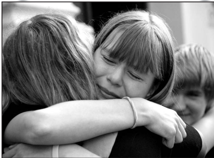
Slzy provázely o posledním školním dni loučení žáků devátých tříd se Základní školou Boženy Němcové.

Město investuje do škol každým rokem a postupně. Za posledních 16 let se u všech podařilo odstranit havarijní stav střech. Všechna školní hřiště procházejí modernizací. V září například bude otevřeno školní hřiště s umělými povrchy na ZŠ Havlíčkova, do kterého město inve-