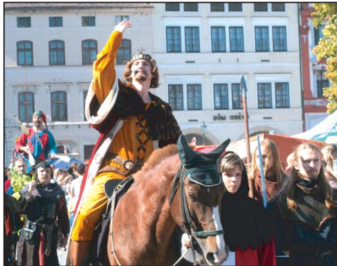
I letos zahájí vinobraní příjezd krále Karla IV. s družinou.