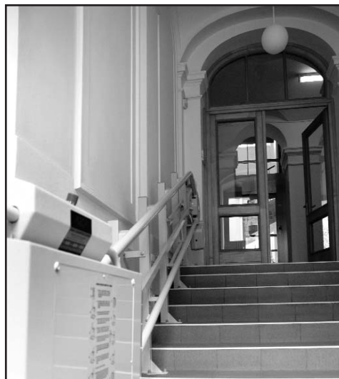
Budova úřadu v Pekařské ulici má kromě nového výtahu i plošinu pro vozíčkáře ve vstupní části budovy.

K realizaci projektu dojde zřejmě v příštím roce. Jednotlivá nástupiště autobusového nádraží mají mít tzv. hřebenovitý charakter, podobně jako tomu je v Českých Budějovicích. (eva)