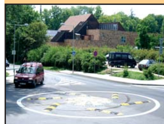
Někteří řidiči si na nový kruhový objezd dosud nezvykli.

V posledních dnech došlo v oblasti dopravy ke dvěma zásadním změnám. Zkušebnímu provozu semaforů regulujících dopravu Na Valech a vybudování nového kruhového objezdu v Daliborově ulici (foto dole). „Řidiči, ale i chodci musejí být opatrní. Některým účastníkům silničního provozu déle trvá, než si na změny zvyknou,“ konstatoval v této souvislosti starosta Ladislav Chlupáč. (eva)