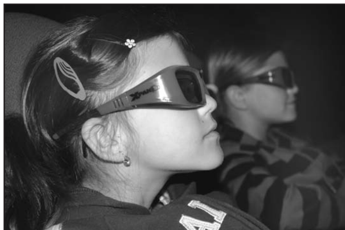
Kino nabídlo i malým návštěvníkům možnost sledovat snímek ve 3D provedení se speciálními brýlemi.

O slibné budoucnosti kina Máj se na vlastní oči mohli přesvědčit návštěvníci, kteří se 7. května zúčastnili jedné ze tří projekcí, při nichž byl využit digitální projektor v kvalitě současných standardů DCI („Digital Cinema“) a ve 3D provedení. Promítány ve 3D kvalitě byly snímky Divoké Safari a Strašidelný zámek, ve večerních hodinách pak první 3D horor Krvavý Valentýn, opět v trojrozměrném provedení se speciálními brýlemi. Akce se konala ve spolupráci s firmou Xtreme Cinemas a Unii digitálních kin.