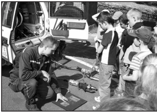
Hasiči ukazovali na dopravním hřišti dětem, jaké používají vybavení.

Hlídky strážníků budou v ulicích města a na cyklostezce podél Labe kontrolovat, zda děti a mládež do 18 let nosí při jízdě na kole přilbu. „Vzorné cyklisty stejně jako v předchozích le-