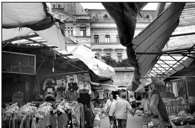
Vzhled tržnice by se měl v příštích letech změnit k lepšímu.

V současné době je využívána pouze spodní část tržnice. Horní je uzavřená a prázdná. Platí však záměr prodeje pozemku horní části tržnice schválený zastupitelstvem v minulých letech. „Prodej pozemku je pod-