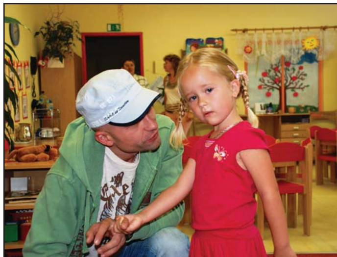
Đetř v mateřkách přibývá.