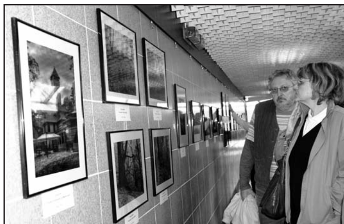
Vernisáže nejúspěšnějších fotografií se v DK účastnily desítky lidí.