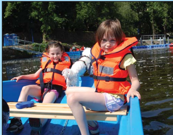
Vyjíždky na loďce se staly oblíbené hlavně pro rodiny s dětmi, které obsluha vybavuje záchrannými vestičkami.

„V sobotu a v neděli 16. a 17. května jsme zaregistrovali téměř pět desítek výpůjček,“ informoval Martin Moravec, zaměstnanec Technických služeb Města Litoměřice, které půjčovnu provozují. Podle něj nové služby využívají hlavně rodiny s malými dětmi a páry lidí, kteří si chtějí užít romantické vyjížďky po Labi. Při nástupu do loďky či šlapadla jsou zákazníci informováni o tom, kudy lze bez větší námahy doplnout na druhou stranu břehu, kde je proud řeky slabší a kde silnější. Pro případ potřeby je na loďce i šlapadle napsáno telefonní číslo obsluhy.