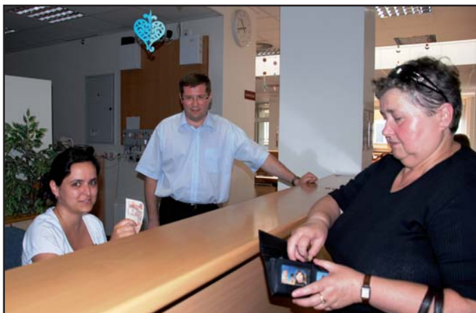
Regulační poplatky platí klienti nemocnice v její vstupní části.