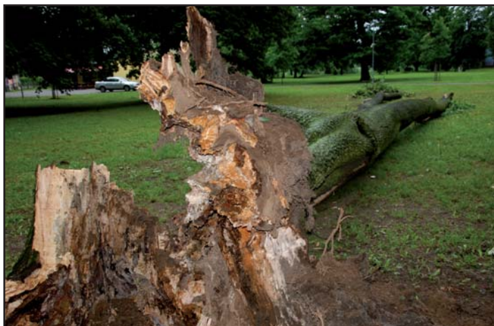
Vzrostlý javor rostoucí na Střeleckém ostrově desítky let vyvrátil silný vítr z kořenů.

Podle pracovníce odboru životního prostředí městského úřadu Lenky Brožové nejde o výjimečnou situaci. „I loni se zde jeden javor zcela vyloupil ze země. Na tomto místě je totiž vysoká hladina spodní vody, což u některých stromů způsobuje kořenovou nestabilitu,“ vysvětlila Lenka Brožová. V případě opravdu silných poryvů větru je proto lepší se v blízkosti stromů na Střeleckém ostrově nezdržovat. (eva)