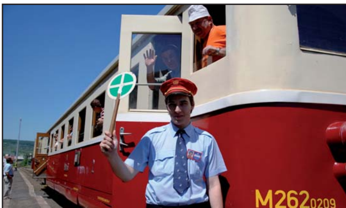
Motoráček zajíždějící z Mostu na litoměřické horní nádraží získává u turistů oblibu.

„Švestkovou dráhu na trati Most – Lovosice – Litoměřice provo-