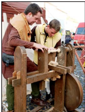
Na vinobraní nechybějí ani ukázky dobových řemesel.