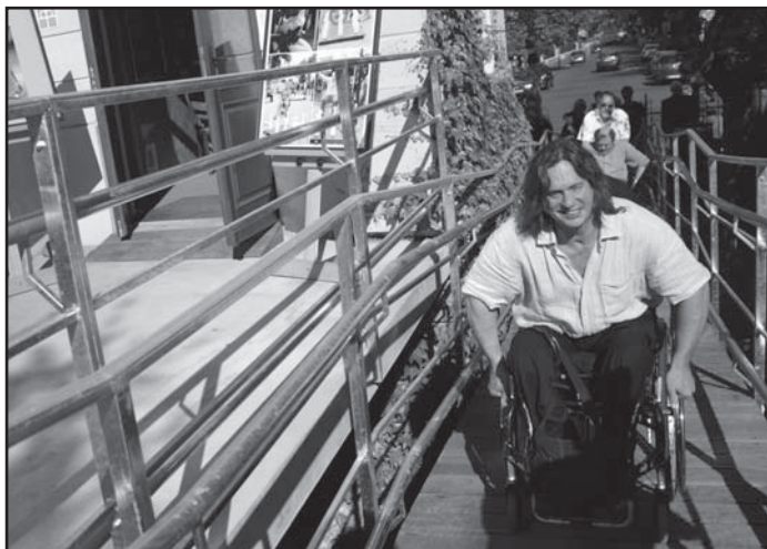
Jan Potměšil byl milým hostem společenské akce Diakonie. Rozdal mnoho podpisů a trpělivě se fotil s klienty Diakonie.

Na invalidní vozíček upoutaný herec Jan Potměšil byl prvním vozíčkářem, který vyjel po nově vybudované nájezdní rampě do čajovny Hóra provozované Diako-