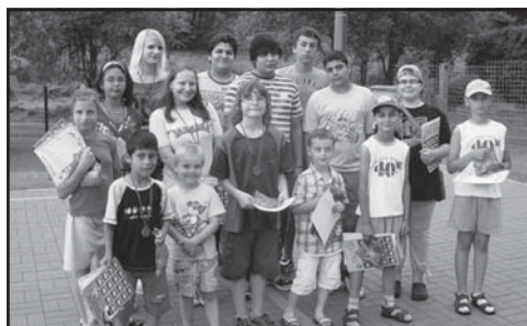
Dětem z pěstounských rodin se ve Lhotsku líbilo.

Víkend přinesl spoustu aktivit – míčové hry, táborák spojený s opékáním buřtů, módní přehlídka strašidel, ruční práce, jako zdobení květináčů ubrouskovou technikou, malování na hedvábí nebo navlékání korálků. Zatímco děti tvořily, dospělí si mezitím povídali s odborníkem o výchovných