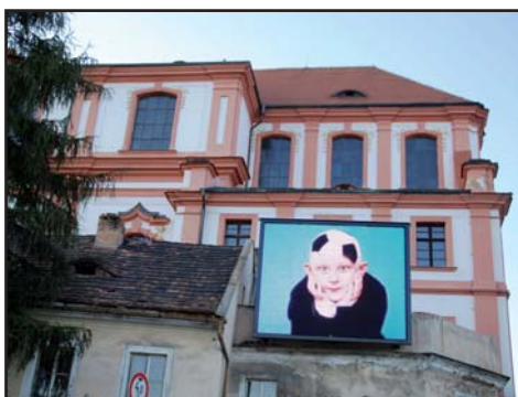
Obrazovka hyzdila pohled na historickou část náměstí.