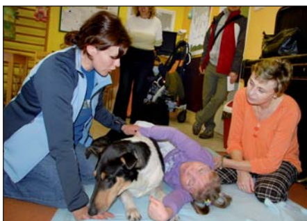
Speciálně cvičení psi přinášejí postiženým dětem dosud nepoznané prožitky.

Dvě cvičitelky z občanského sdružení Aaja zprostředkovaly první kontakty se zvířaty. Hlavně pro děti těžce postižené, pro něž se nové aktivity hledají jen velmi obtížně, je styk se zvířetem něčím novým a mnohdy dosud nepoznaným. „Dochází při něm k uvolnění svalů, rozvoji ci-