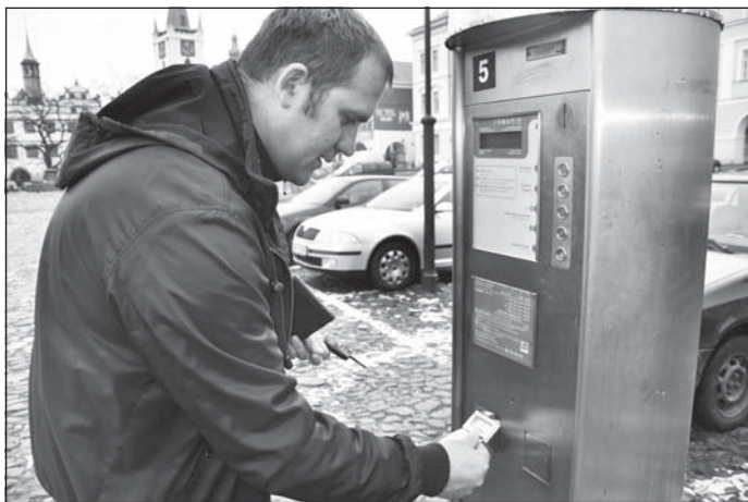
Parkovné se ve vyznačených zónách platí ve všední den v době od 8 do 18 hodin, v sobotu od 8 do 14 hodin.

Zvýšení cen se týká centra města a přilehlých ulic (Dlouhá, Velká Dominikánská, 5. května, Lidická apod.). Zatímco zde dříve řidiči zaplatili za půlhodinu parkování pětikorunu a za každou další hodinu desetikorunu, od 1. ledna to je deset korun za třicet minut a za každou další započatou hodinu dvacet korun. Zvedla se i cena na parkovišti U Hvězdárny, a to z dřívější pětikoruny za hodinu stání na desetikorunu. Výše parkovného ve 2. zóně, zahrnující tři záchytné plochy Na Valech, se u hodinové sazby nezměnila. I nadále zde řidiči platí pět korun za hodinu stání. Ke zvýšení ceny ale