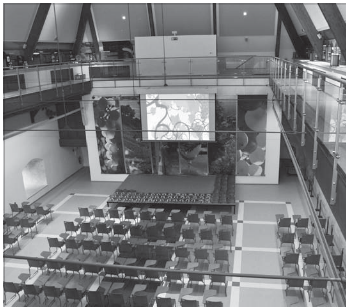
Pomyslným srdcem gotického hradu je konferenční sál pro zhruba dvě stě osob. V patře, které lemuje sál po celém jeho obvodu, byla instalována výstava o českém a moravském vlnařství.

Gotický hrad byl v lednu po náročné modernizaci úspěšně zkolaudován, a to jak po stavební, tak i po interiérové stránce. Jeho provozovatelem se dle rozhodnutí radních stalo Centrum cestovního ruchu, příspěvková organizace města. V únoru a v březnu bude ve zkušebním provozu. (eva)