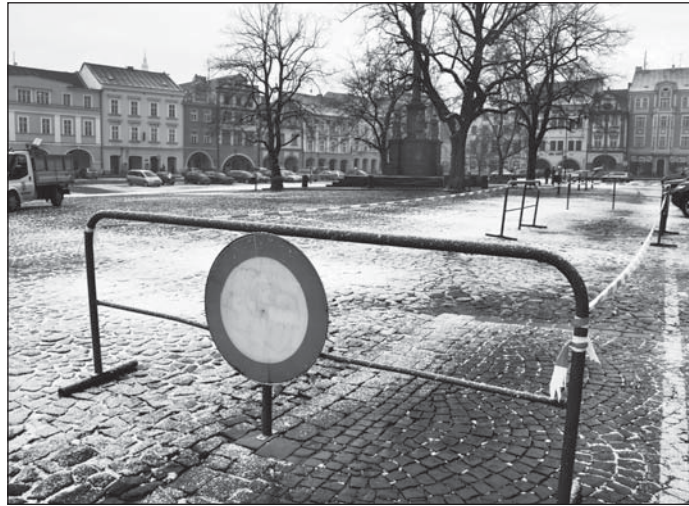
Na místo, kde se nečekaně objevily nerovnosti vozovky, je vjezd i vstup zakázán.

Město je rozděleno do tří zón, čemuž odpovídá i intenzita úklidu. Každý den jsou psí hromádky sbírány v historické jádru města. Na sídliště vyjíždějí sběrači jednou týdně. (eva)