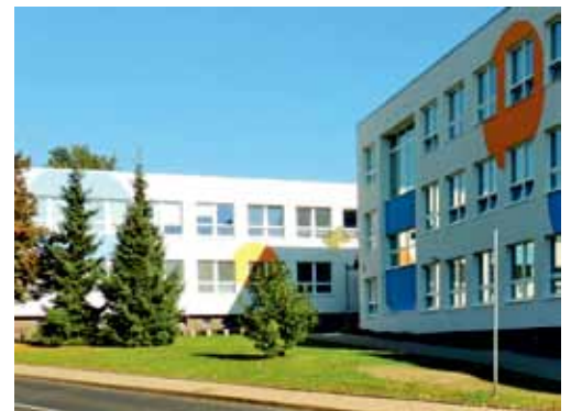
Na prvním snímku vidíme, jak budova, respektive její vstupní část, vypadala v sedmdesátých letech. Druhý přibližuje stav současný.