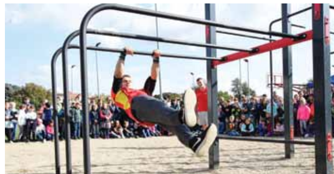
Slavnostní otevření workoutového hřiště Masarykovy základní školy doprovázela zábavný program se soutěžemi pro děti. Sportovní show předvedli členové klubu Workout Mělník.