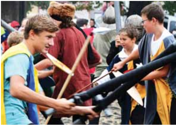
Následně již na podiu řinčely zbraně a zněla píseň „Ktož sú boží bojovníci“. To žáci Masarykovy základní školy připomněli zapojení města do husitských válek.