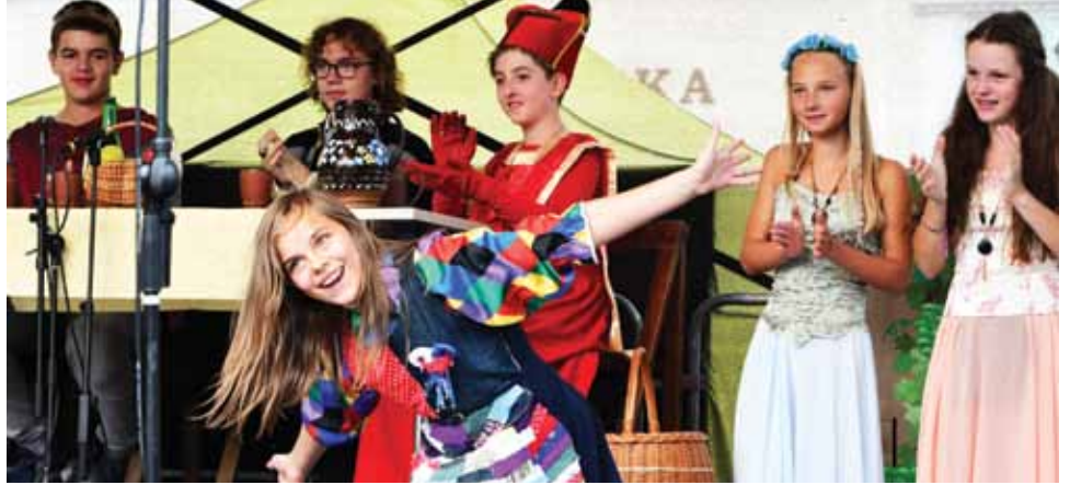
Do Litoměřic přijel i Karel IV. s družinou v podání žáků Lingua Universal. Nechyběl rytířský soubor, tanec dvorních dam nebo vystoupení šaška. Na závěr král daroval Litoměřickým svahy Radobýlu. A právě takové bylo 14. století.