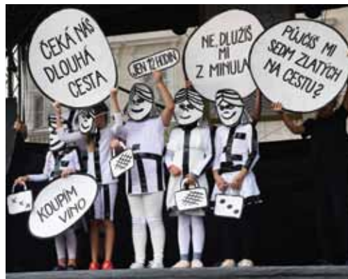
Tváře dětí ze ZŠ Havlíčkova zůstaly skryty. Založení 1. české soukromé školy v Litoměřicích v 19. století ztvárnily osobitým způsobem.