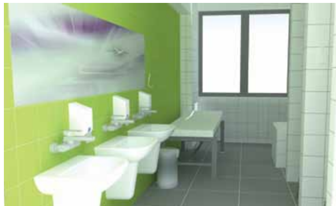
Nové koupelny v oku lahodících barvách již slouží malým pacientům.

Práce začaly začátkem července vybouráním stávajícího vybavení a vybudováním nových rozvodů elektřiny, vody a odpadů. Následovalo vyzdění nových sprchovacích boxů, realizace obkladů a dlažby. Na ty na přelomu července a srpna navázalo osazení vany, několika umyvadel a vybavení zařizovacími předměty. Náklady na vybudování nové koupelny na dětském oddělení přesáhly částku půl milionu korun. Ty nemocnice vynaložila z vlastních zdrojů.