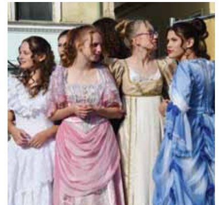
17. století spojené se založením biskupství ztvárnili žáci ZŠ U Stadionu. Nechyběly ani dobové kostýmy.