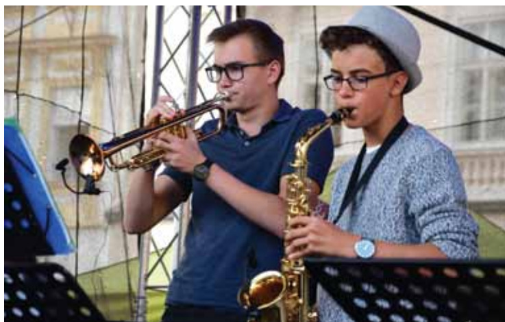
1. DEN MĚSTSKÝCH SLAVNOSTÍ: Sobotní odpoledne patřilo žákům a pedagogům ZUŠ. Den zakončil videomapping (viz strana 1).