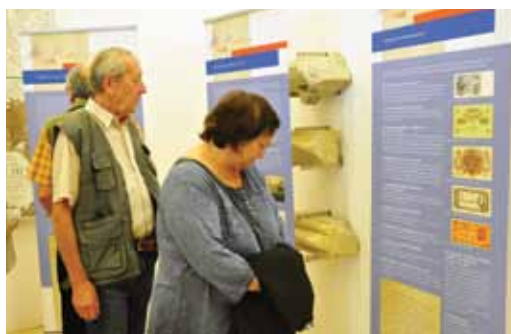
Výstavu je možné zhlédnout v hradní galerii do konce října.

Výstava mimo jiné přináší popis historických dat a příčin exodu, popis hospodaření volyňských Čechů, české školství na Volyni nebo také působení Volyňských Čechů v armádách v průběhu obou světových válek. Akce se koná u příležitosti výročí 800 let založení města v rámci projektu „Najdi si svého válečného veterána“, který bude určen žákům