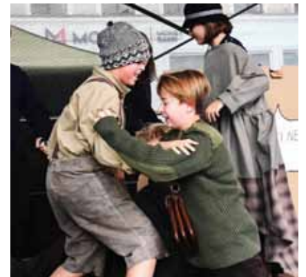
Vyhnaní Čechů na začátku a vyhnaní českých Němců po II. světové válce připomněli žáci ZŠ Na Valech.