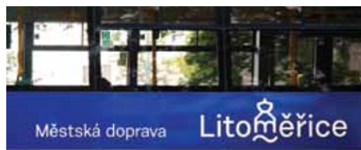
V Litoměřicích jezdí moderní klimatizované autobusy s novým logem města.

Kontrola způsobu likvidace komunálního odpadu u podnikatelů probíhá intenzivně již několik týdnů. Úřad prověřil zatím téměř 30 podnikatelů, u nichž požadoval prokázání likvidace odpadu prostřednictvím najaté firmy, nebo doklad o odevzdání odpadků ve sběrných surovinách. Výsledky kontroly nejsou prozatím k dispozici, neboť oslovené firmy