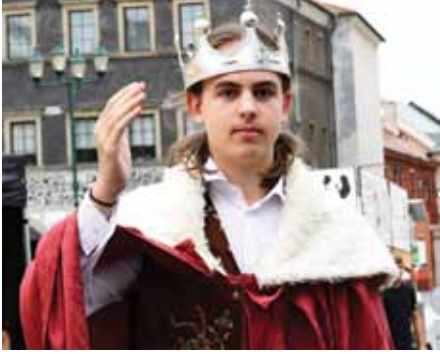
Žáci základních škol a víceletého gymnázia v rámci slavností ztvárnili „Osm století příběhů“. Nejprve děti ze 6. až 9. třídy ZŠ Ladova vrátily publikum do 13. století, v němž Přemysl Otakar I. (na snímku) udělil Litoměřickým městská práva.