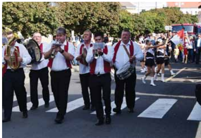
2. DEN: Zhruba 1 300 lidí se zapojilo do průvodu Litoměřičanů, vedeného Podřípským žestovým kvintetem.