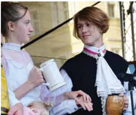
V 18. století byl založen litoměřický pivovar. Vystoupení gymnazistů se pochopitelně neslo právě v tomto duchu.