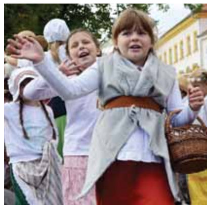
Obrovský potlesk publika zaznamenala i „Božena“, jež ztvárnila období 16. století spojené s renesancí.