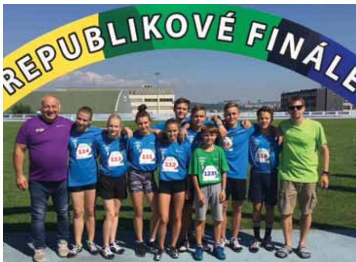
Tým Ladovy ZŠ se umístil v republikovém finále na krásném druhém místě, kdy prvenství uniklo jen o několik málo bodů.

ZŠ Ladova reprezentovalo 8 dětí, a to v 10 disciplínách složených z atletiky, silových a dovednostních disciplín. „Soutěž má velkou vypovídající hodnotu o sportovní kvalitě dětí,“ poukázal na vysokou úroveň akce Tomáš Vytlačil, který na ZŠ Ladova vede sportovní třídy. Do Brna vyrazil společně s dětmi, které se vrátily nadšené. „Líbí se nám hezká