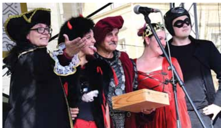
2. DEN: Divadelní soubor Li-Di vložil do rukou starosty skříňku obsahující poselství příštím generacím. Uložena bude ve věži Kalichu.