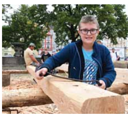
Děti i dospělí zkoušeli opracovat dřevo, jež bude použito na opravu krovu Kalichu. /eva/